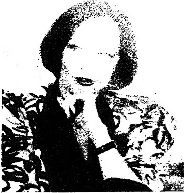
الممثلة ليسلي كارون

وعندما سالها المخرج اير فريد عن العمل الذي ترغب في تفيذه سواء على المسرح او السينما اجابتها اريد ان اعمل فيلما تسوده الرقصات.